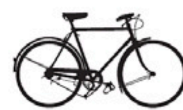
34 Condor No. 60