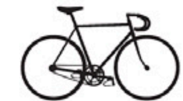
82 Tigra Titan Bahn