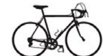
130 Pinarello Speciale