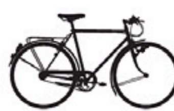
30 Condor 55B