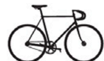
126 Pinarello Pista