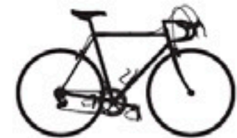
70 Rüeegger Special