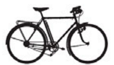
38 Cosmos CH 4L