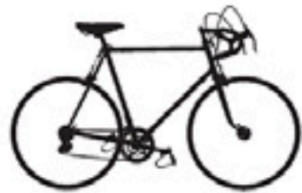
18 Allegro Special