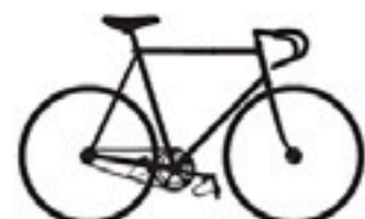
122 Masi Special Pista