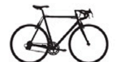
134 Somec Pro Max CZ