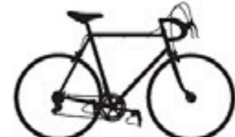
118 Masi Gran Criterium