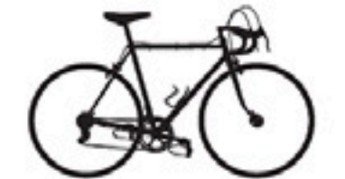
86 Tigra Professionnel