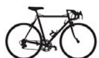
114 Colner Profil Sistem